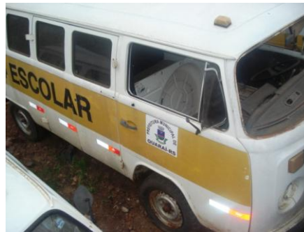
LOTE - 12