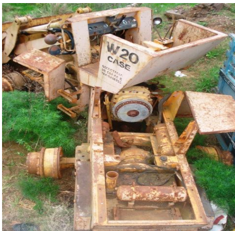
LOTE - 01