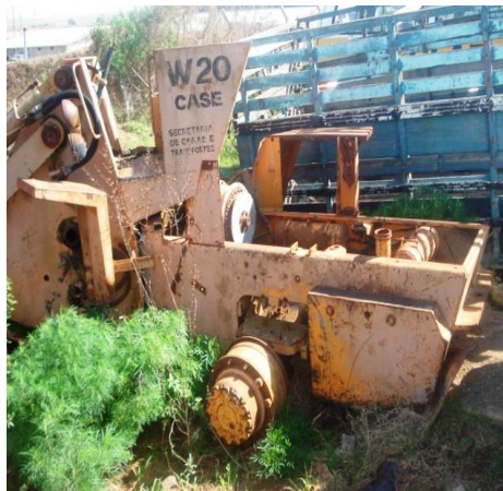
LOTE - 02