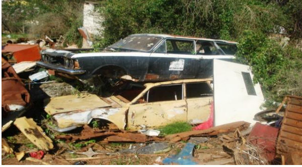
LOTE – 06