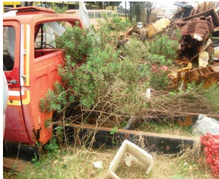
LOTE - 03